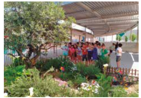
Imágenes enviadas por CPI San Jorge

siempre estamos pensando cómo mejorar para dejar una menor huella ecológica. Queremos compartir con todo el barrio el video ganador: www.n9.cl/a95hv