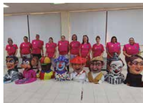
Imágenes enviadas por Cabezudos Valdespartera

mañana. Realizamos el primer taller de látigos, donde nos sobrepasaron con el número de niños que bajaron a por el suyo.