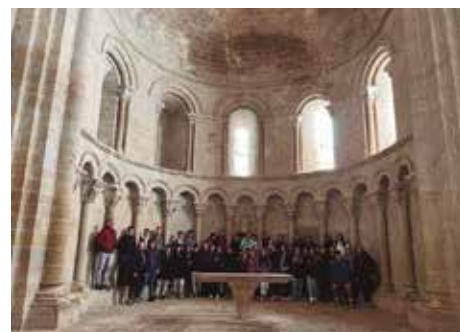
Imágenes enviadas por CPI Rosales del Canal

actividades culturales en nuestra comunidad. El mes pasado, nuestros alumnos visitaron su centro, teniendo la oportunidad de conocer el sistema educativo y la cultura alemana de cerca.